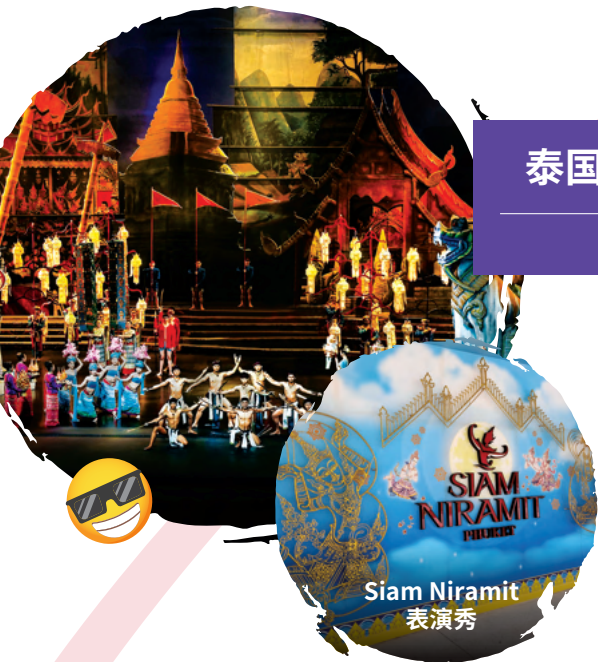
Siam Niramit 表演秀