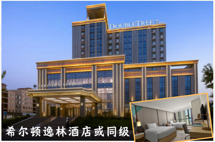
希尔顿逸林酒店或同级