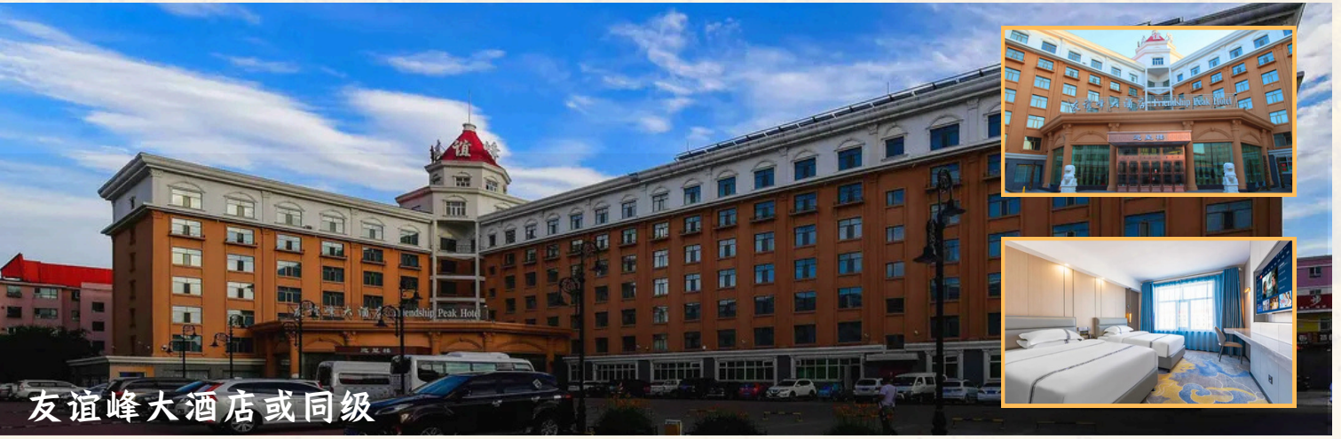
友谊峰大酒店或同级