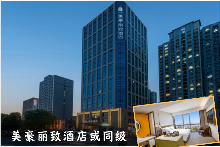
美豪丽致酒店或同级

享受 ★★★★★ HOTEL SPECIALTY HOTEL QUALITY JOURNEY