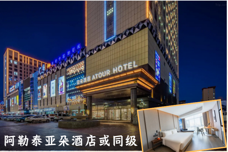
阿勒泰亚朵酒店或同级