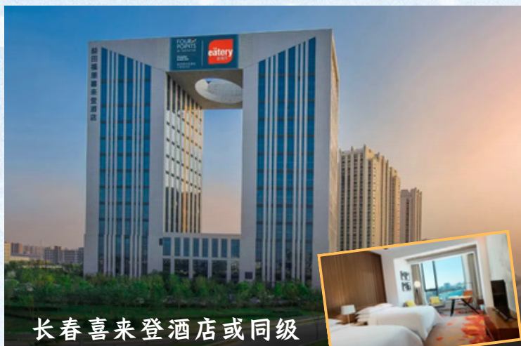
长春喜来登酒店或同级

享受 ★★★★ HOTEL SPECIALTY HOTEL QUALITY JOURNEY