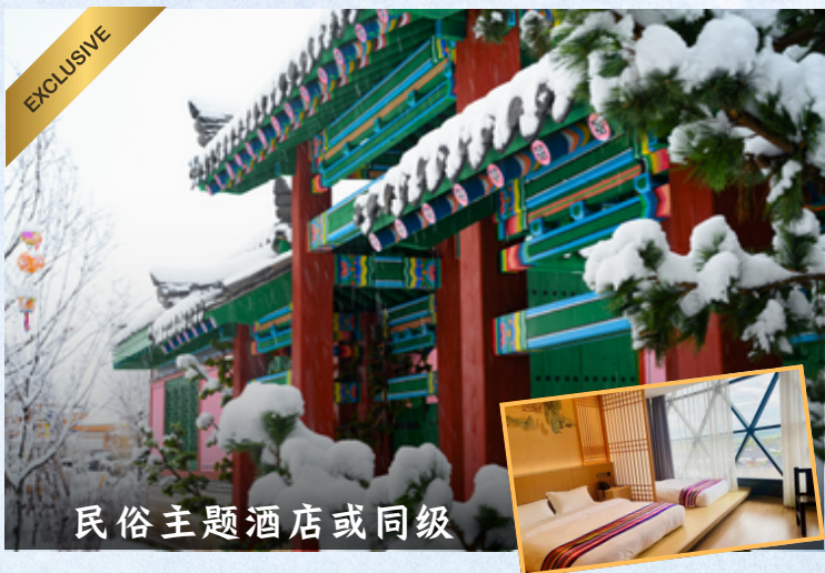
民俗主题酒店或同级