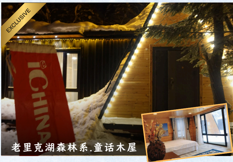
老里克湖森林系. 童话木屋