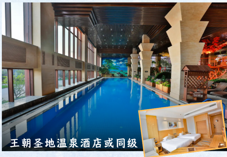
王朝圣地温泉酒店或同级