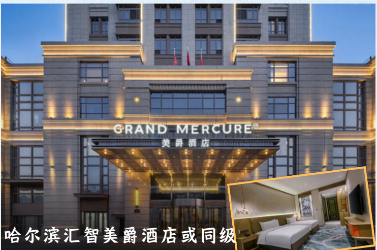
哈尔滨汇智美爵酒店或同级