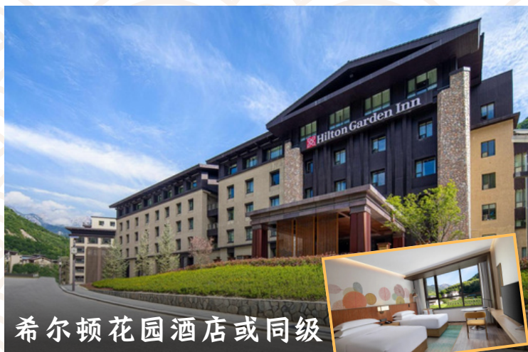
希尔顿花园酒店或同级