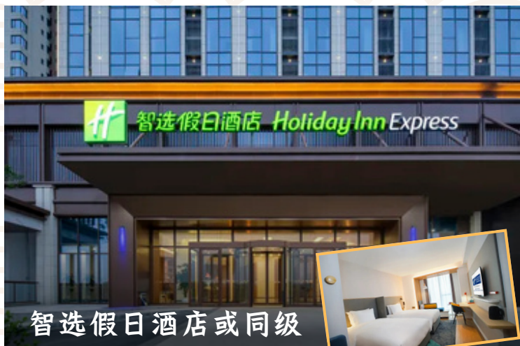
智选假日酒店或同级