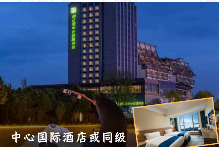
中心国际酒店或同级