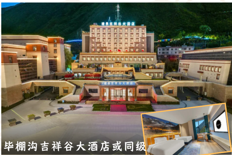
毕棚沟吉祥谷大酒店或同级