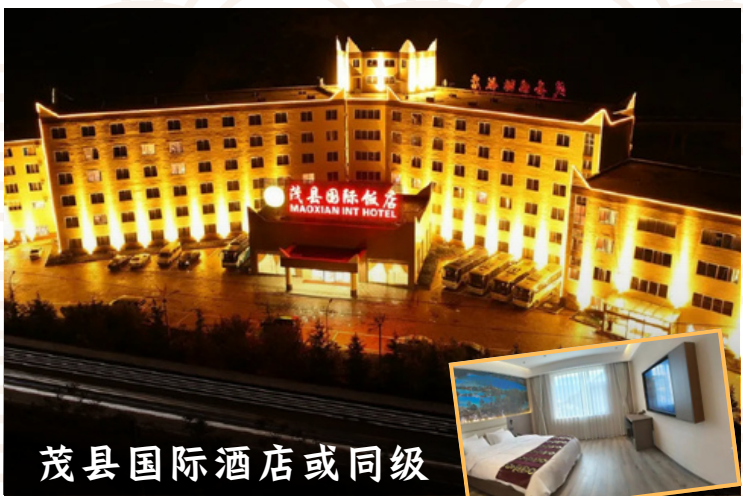
茂县国际酒店或同级