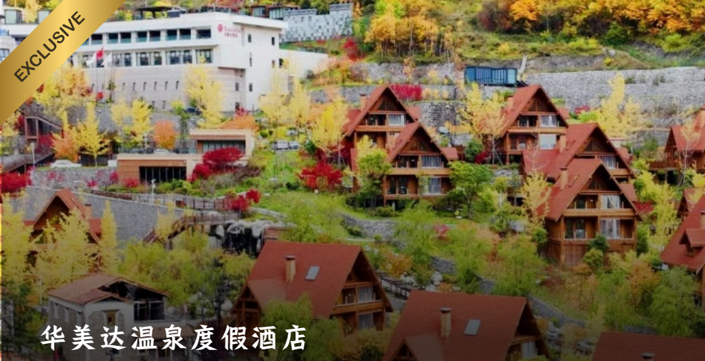
华美达温泉度假酒店