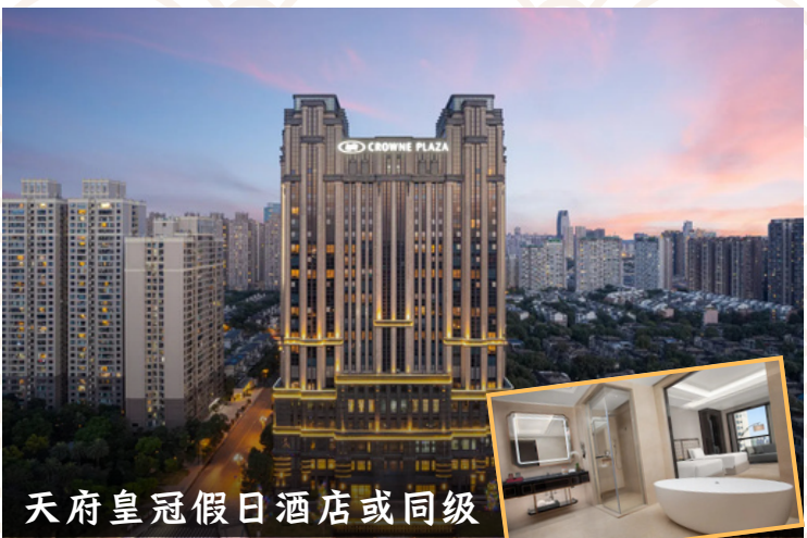
天府皇冠假日酒店或同级