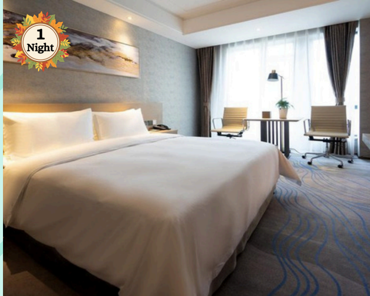
Galactic Select Hotel or Similar