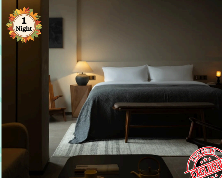
Mount Villa by T Residence