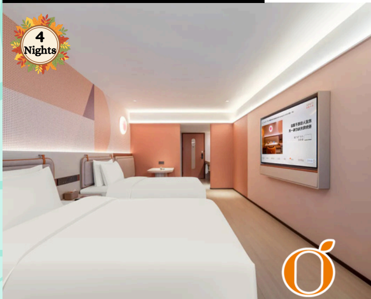
Orange Hotel ORANGE 桔子酒店